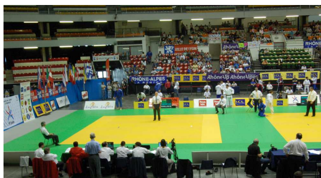
Compétition de judo 2007 au Palais des Sports de Gerland

Le Championnat de France jeunes pourra donc profiter de cet afflux d'un public aimant le sport et peut-être curieux de connaître les joies du badminton.