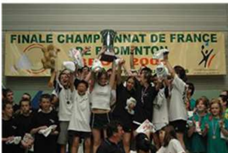
L'équipe départementale Jeune Championne de France 2005.

L'équipe départementale Jeunes a aussi participé au championnat de France Intercodep, et est devenue championne de France 2005. Enfin, le Comité Départemental de Badminton du Rhône a été l'organisateur du championnat de France par équipes Jeunes en 2005 et 2006.